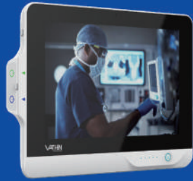
12.1인치 터치스크린 LCD 모니터

H 스테리스코프 내시경은 사용자 중심의 직관적 GUI(Graphical User Interface)와 한글화된 소프트웨어가 탑재된 스마트 내시경으로서 5가지 다양한 직경의 스코프를 시술 부위에 맞게 선택한 뒤 실시간으로 영상을 확인하거나 캡처 및 동영상을 저장할 수 있습니다.