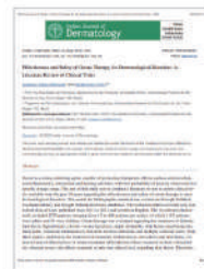
Indian J Dermatol. 2022 피부질환에 대한 오존 치료의 효과 및 안전성