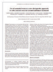
EXPERIMENTAL AND THERAPEUTIC MEDICINE 2018 오존수를 이용한 항암치료