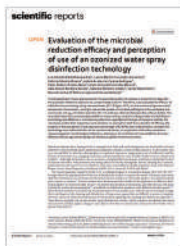
Nature Scientific Reports 2022 오존수 미생물 감소 살균 효과