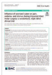
BMC Oral Health 2020 오존수가 통증에 미치는 영향