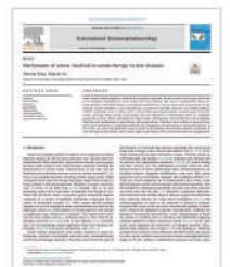
International Immunopharmacology 2018 피부질환에 대한 오존요법과 관련된 작용 메커니즘