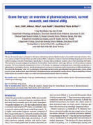
2017 Medical Gas Research 오존요법 치료 및 임상적 유용성